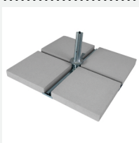
Podstawa PDUE-B50 RIO