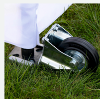
Kółka do transportu