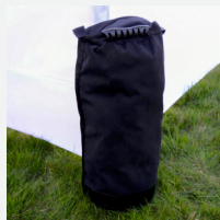
Torba z obciążeniem