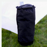
Torba z obciążeniem