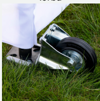
Kółka do transportu